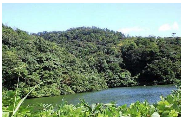
矢中池(津ノ井ニュータウン付近)

主な目標は、情報システム学科の学生の皆さんに数学の力を十分につけてもらうことです。そのため、数学の学習に熱意を持って取り組んでもらえるよう、歴史的社会的背景を十分に盛り込んだ数学理論の解説を行い、数学のおもしろさと奥深さを感じる機会を提供したいと考えています。そして、そんな機会を提供するため、数学史、科学史、数学教育に関する研究にも今後取り組みたいと考えています。