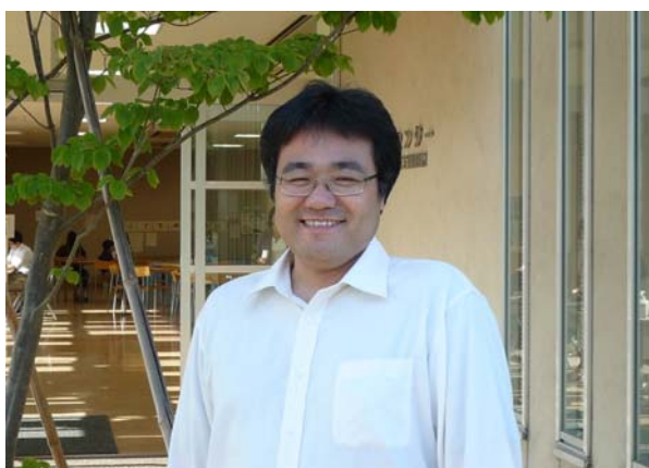
学生センター前にて

平成 21 年 8 月 1 日付けで情報システム学科に講師として着任しました。前職は(独)産業技術総合研究所・産総研特別研究員です。大阪にて勤務しておりました。鳥取に住むのは初めてであり、美しい風景とおいしい食べ物を楽しみにして赴任いたしました。これから、鳥取環境大学という恵まれた環境の中で学生の皆さんと共に学んで行き、学生の皆さんの成長の一助を担うとともに、私自身も成長して行きたいと考えています。